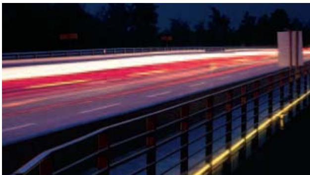
Bild 1 spaceLED als Brückenbeleuchtung

Die TridonicAtco Connection Technology ist Teil der international tätigen TridonicAtco und Zumtobel Gruppe. Die Geschäftsfelder der TridonicAtco Connection Technology sind unterteilt in Installationstechnik, Leuchtenindustrie und Haushaltsgeräte. Größter Wert wird auf die hohe Qualität und Sicherheit der Produkte gelegt, die durch mehr als 20 internationale Prüf- und Qualitätszeichen bestätigt ist.