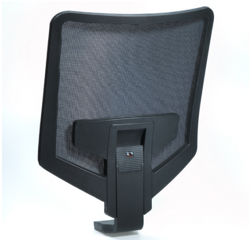
Bild 1 Bürostuhlrückenlehne JET-N

Coko-Werk GmbH & Co. KG ist ein Systemlieferant für technische Kunststoffartikel. Das Angebot umfasst Entwicklung und Konstruktion, einen eigenen Werkzeugbau sowie die Kunststoffverarbeitung bis zur Montage.